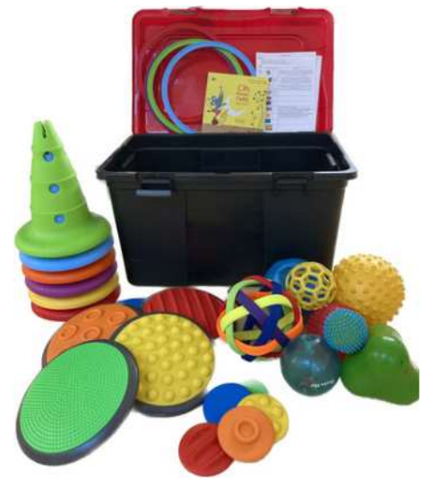
Malle de "motricité"

Les malles sont mises à disposition gratuitement pour une durée d'un mois maximum.