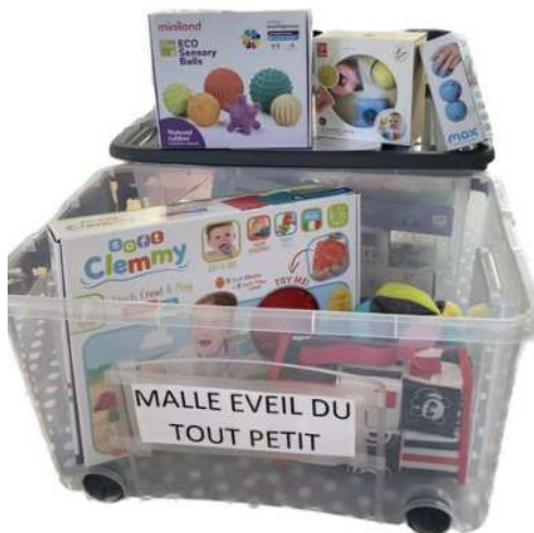
Malle "éveil du tout petit"

Il existe à ce jour 5 malles qui sont mises à disposition: