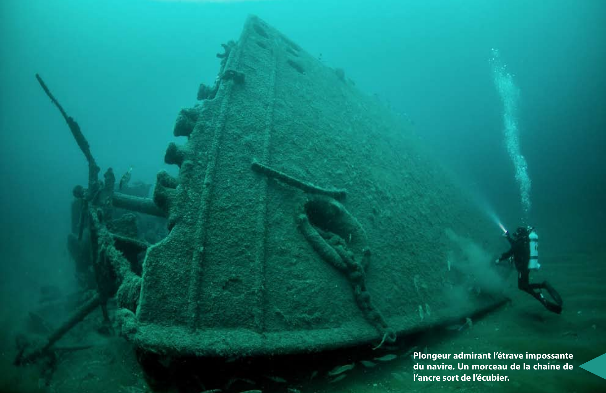
Plongeur admirant l'étrave imposante du navire. Un morceau de la chaîne de l'ancre sort de l'écubier.