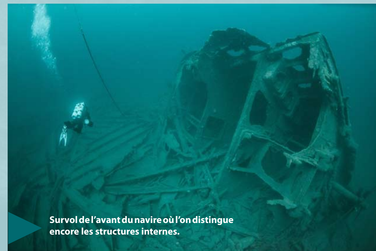
Survol de l'avant du navire où l'on distingue encore les structures internes.

L'épave repose sur le sable à 47 mètres de profondeur