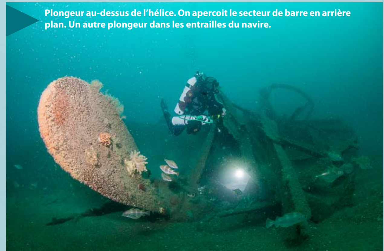
Plongeur au-dessus de l'hélice. On aperçoit le secteur de barre en arrière plan. Un autre plongeur dans les entrailles du navire.

Sa magnifique proue couchée sur tribord, d'énormes pans de tôles, ses trois chaudières, sa machine à vapeur d'où part l'arbre s'en allant rejoindre la grande hélice avec près d'elle le reste de l'appareil à gouverner... L'épave du Sequana , l'une des plus belles de la région, attire chaque année à elle un grand nombre de plongeurs. À la belle saison, elle les accueille dans une eau particulièrement claire.