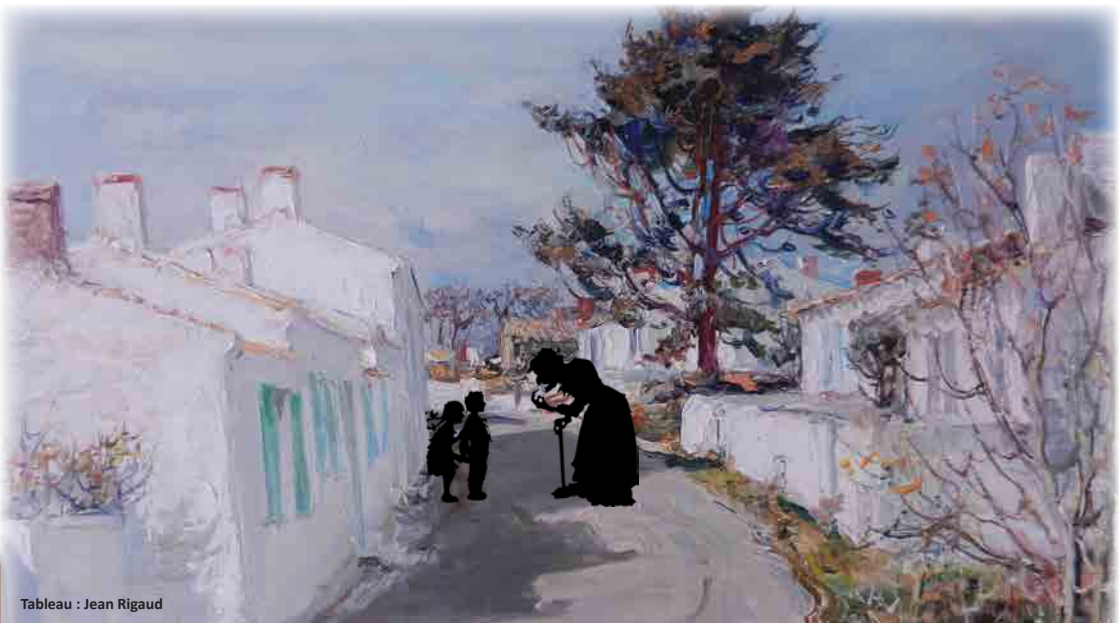
Tableau : Jean Rigaud

Visiter le port de La Meule et son village / Découvrir son patrimoine caché / Comprendre l'histoire du port et du village grâce à un texte explicatif «Le Saviez-vous» qui agrmente chaque énigme / Développer l'esprit d'équipe / Développer le sens de l'observation, de la déduction et le sens de l'orientation.